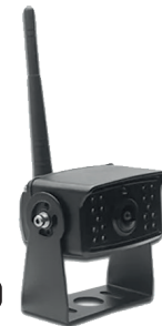
Cámara 90 x 80 x 78 mm FA511040 10/24 V